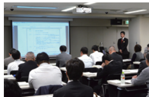
環境法規制セミナー