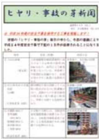
ヒヤリ・事故の芽新聞

各職場から集約され、報告された情報は「ヒヤリ・事故の芽新聞」に掲載されることで潜在する危険についての情報を共有します。また、「ヒヤリ・事故の芽会議」の審議を経て、優先度の高いものについては設備の改善を実施し、事故の芽の早期除去に努めていきます。