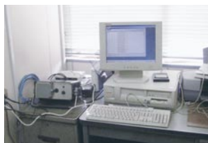
フラット検出装置

線路上に設置される「フラット検出装置」は通過列車の車輪踏面の不具合を早期に発見するための装置です。現在の装置は、平成13年に寝屋川車両基地横に設置され、平成15年より本格的に運用を開始しました。全通過列車の車輪振動および騒音データの中から、基準値を超えた車輪の削正手配を速やかに実施し、乗り心地の改善や走行騒音の低減を効率的に行っています。