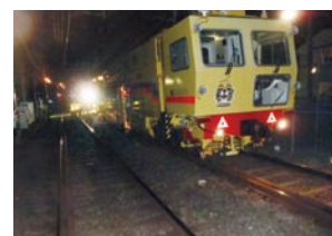
マルチプルタイタンパー