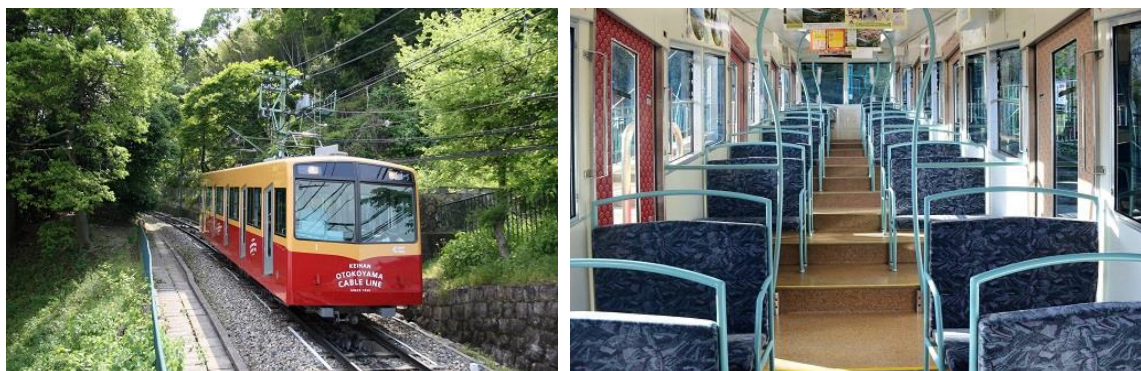
男山ケーブル(左：外観、右：内装)