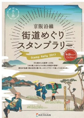
「京阪沿線 街道めぐりスタンプラリー」台紙