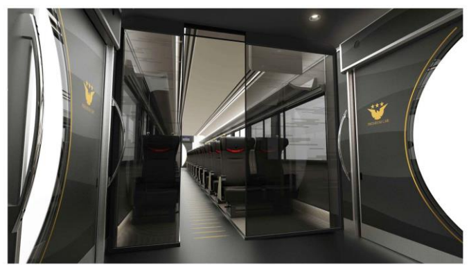
▲「プレミアムカー」内装イメージ