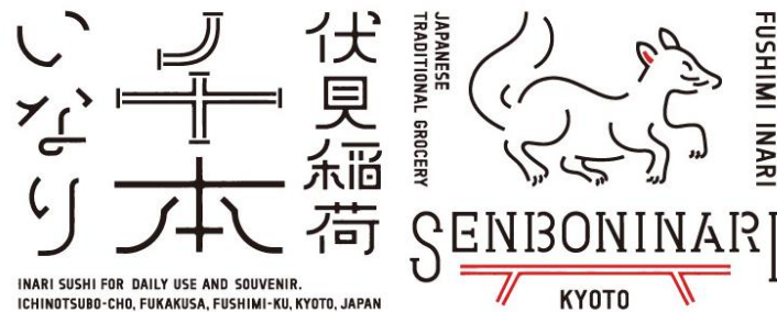
「伏見稲荷 千本いなり」ロゴ

店舗デザインおよび商品パッケージ等に使用するロゴのデザインは、先般、京阪グループに加わった株式会社カフェが制作。稲荷大神様の眷属である「白狐」と伏見稲荷大社の名所である「千本鳥居」をモチーフにしており、インバウンドのお客さまにも分かりやすく、国内観光のお土産としてもご利用いただけます。